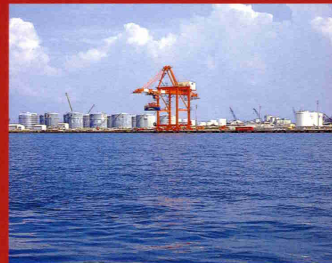
海上から見たオイルターミナル直江津