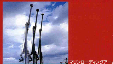
マリンローディングアーム