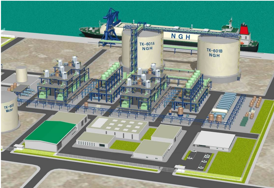
NGH 製造・出荷設備イメージ図