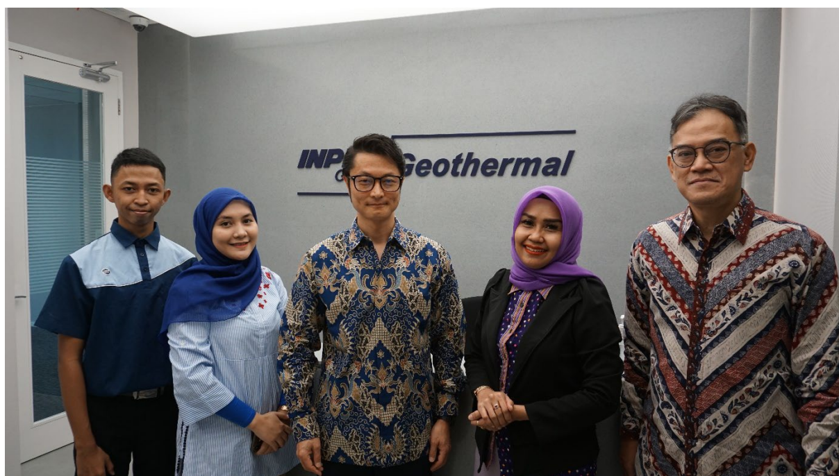
ジャカルタ事務所スタッフ