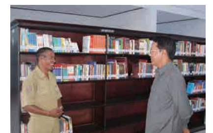
サムラク市図書館への寄付

殖家の活動を支援しています。そのほか、西スマトラ州地震への義援金の提供や、インベックス教育交流財団を通じた留学生支援なども行っています。また、インドネシアで行われるカンファレンスや展示会への出展を通じて、アバディプロジェクトのインドネシアへの貢献を広く理解していただけるよう取り組んでいます。