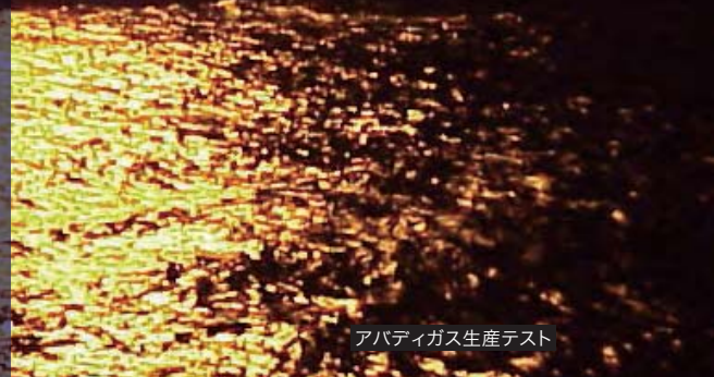
アバディガス生産テスト

*2011年7月にShell社と30%の権益譲渡契約を締結。インドネシア政府の承認等の権益譲渡契約上の先行条件の充足により譲渡発効予定。