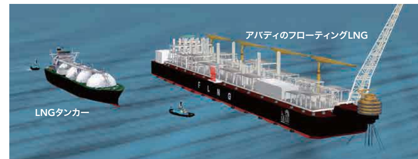
フローティングLNGのイメージ図

「アバディ」という名称は、インドネシア語で「永遠」という意味で、「永遠に燃え続ける」という期待を込めて名付けられました。