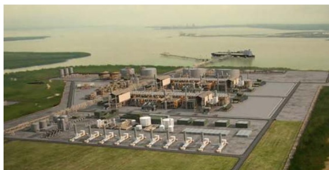
オーストラリア ダーウィンにおける液化天然ガス（LNG）プラント建設イメージ図