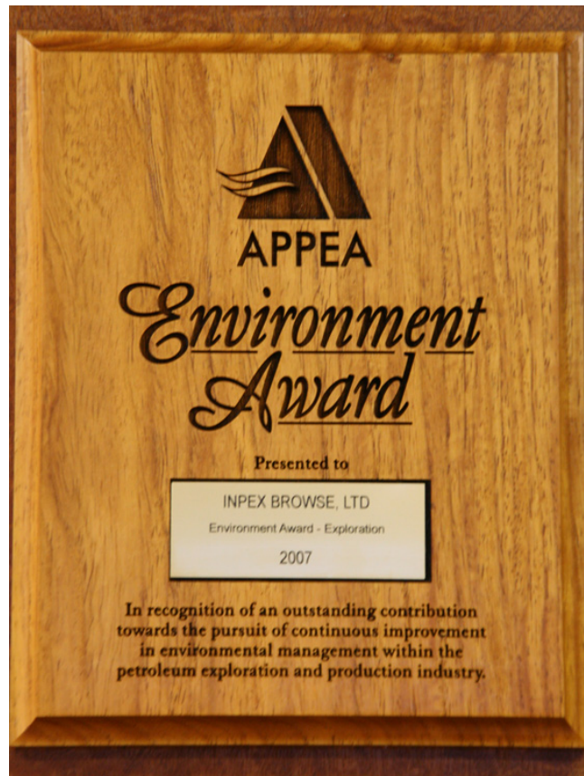
APPEA Environment Award